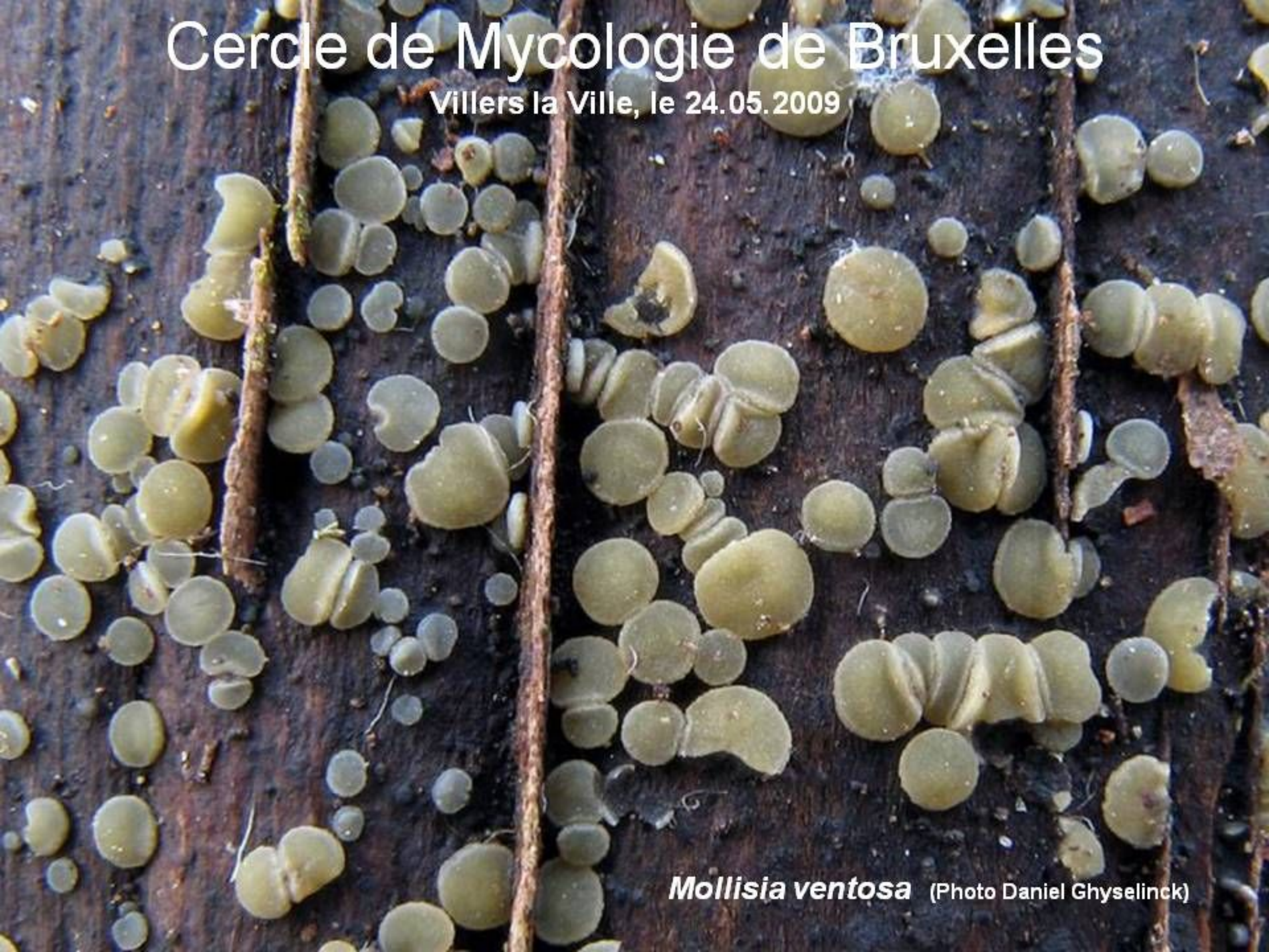
Mollisia ventosa