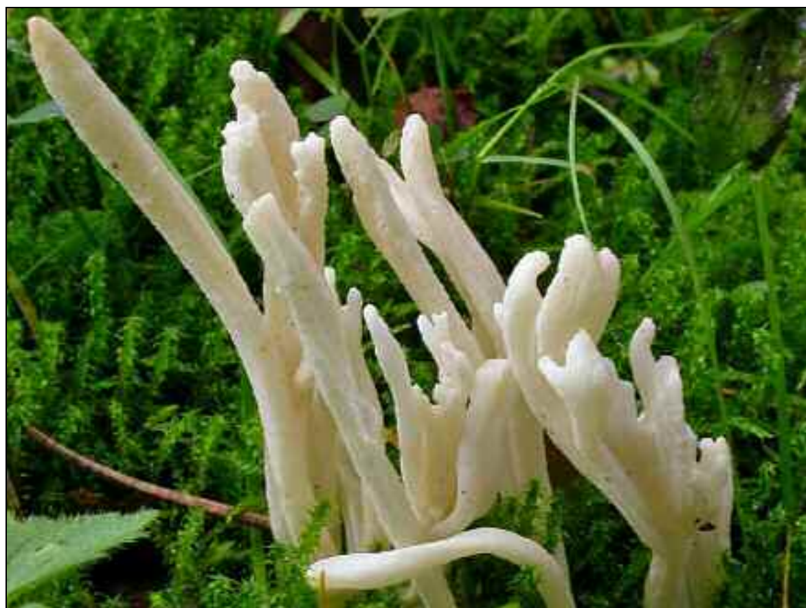
Figure 3. – Clavulina rugosa.