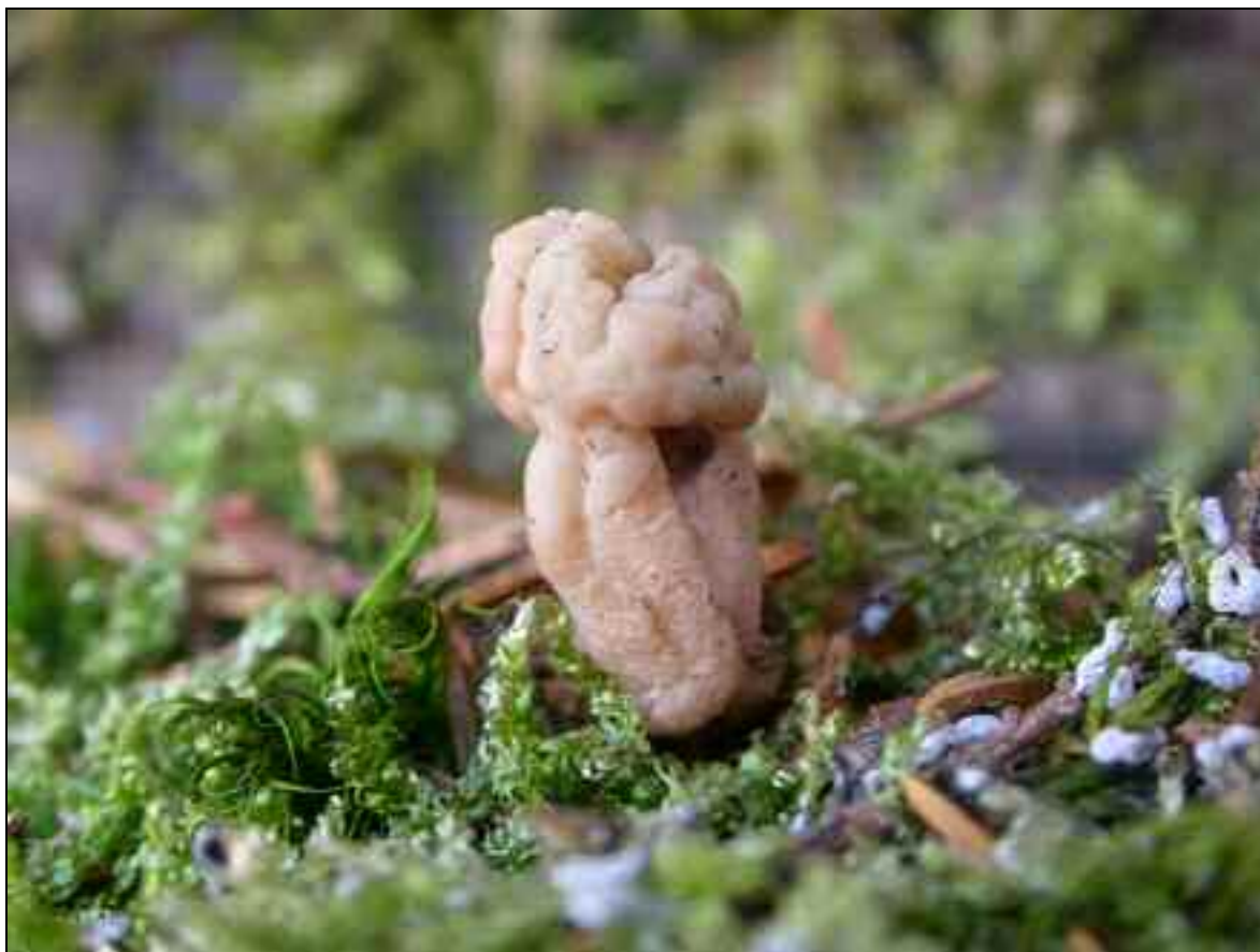
Figure 2. – Clavulina rugosa f. mitruloides.