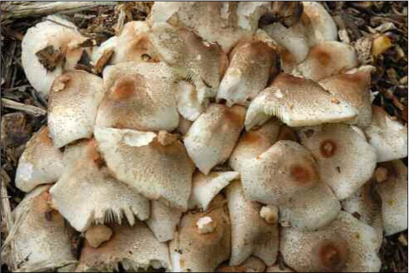
Figure 1. – Leucoagaricus meleagris à Hofstade.