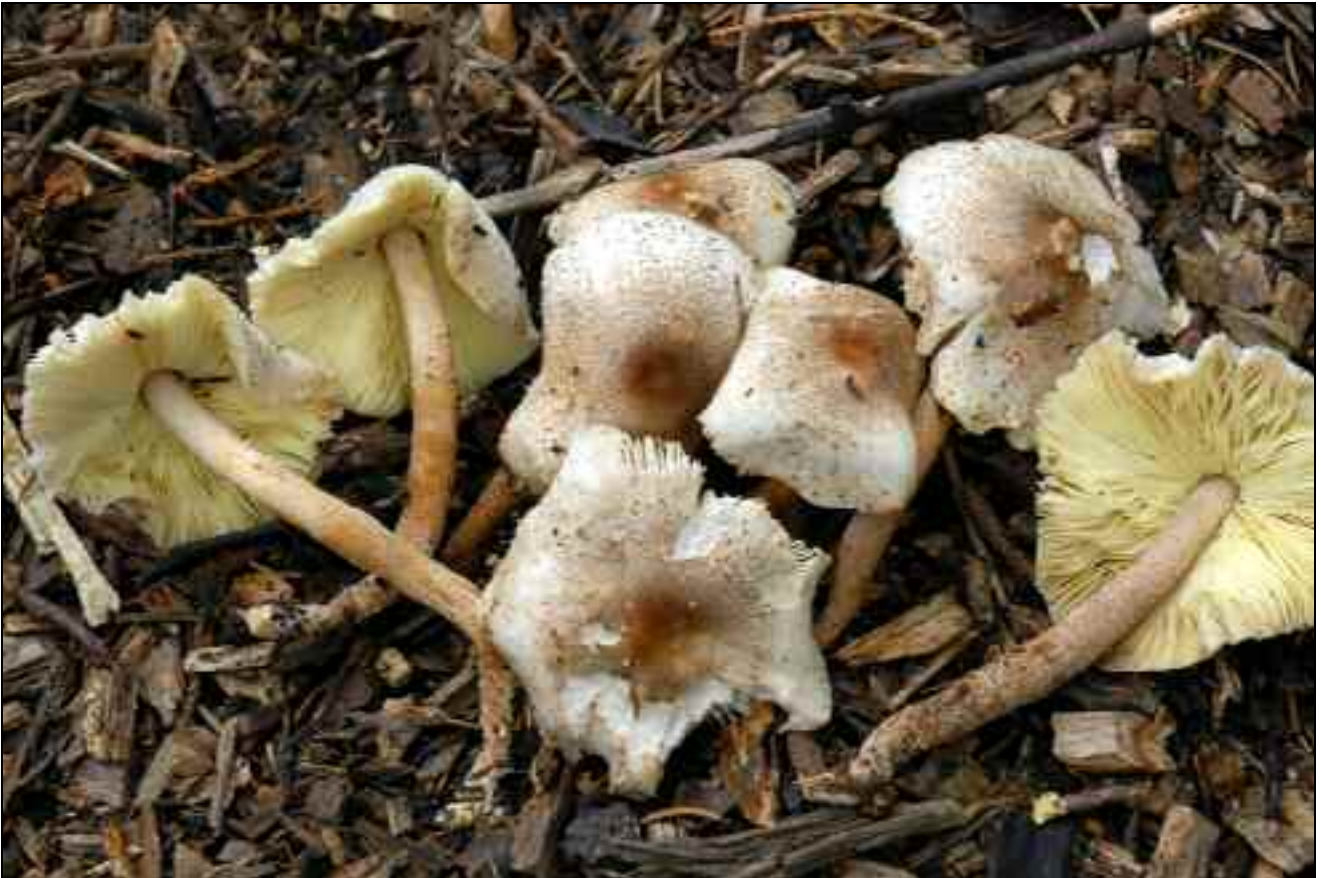
Figure 2. – Leucoagaricus meleagris à Hofstade.